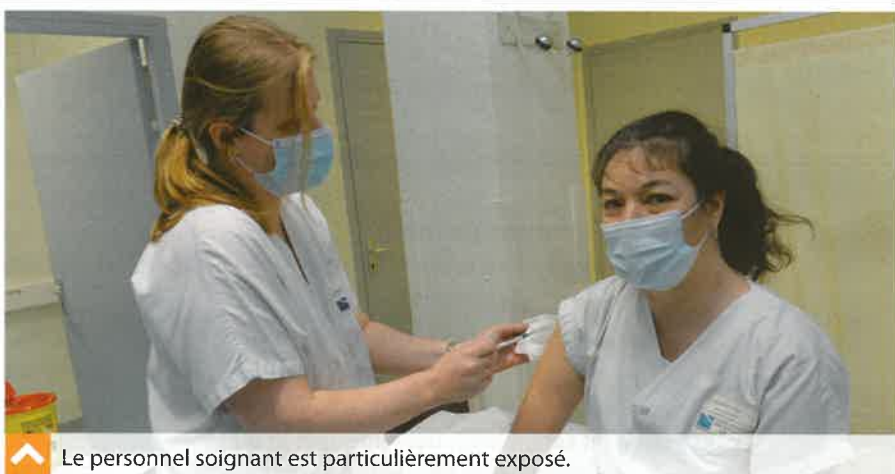
↑ Le personnel soignant est particulièrement exposé.